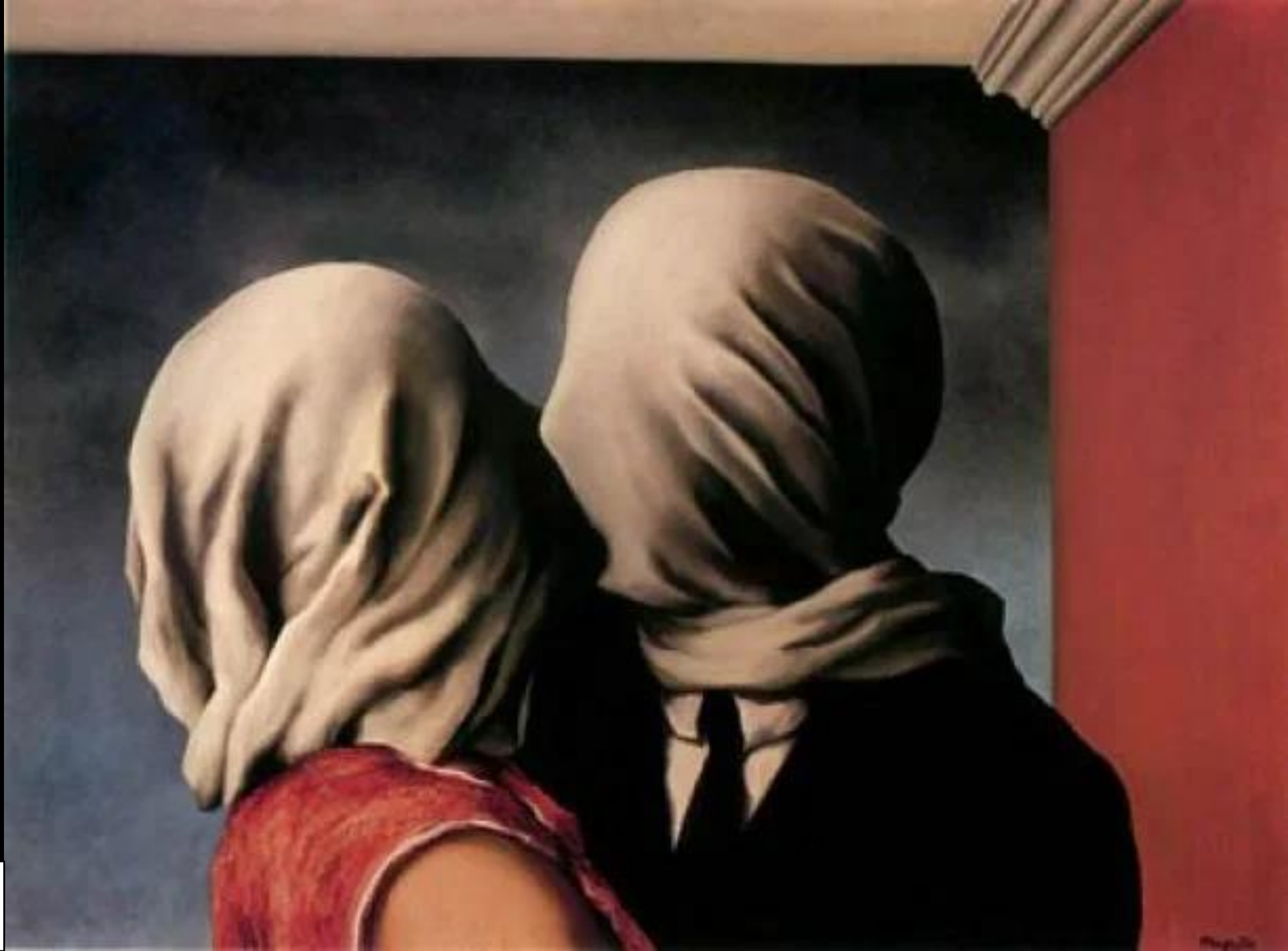
Los amantes. René Magritte (1928)